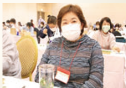
2022.12.7（水）開催 冬期研修会 苔テラリウム制作の様子