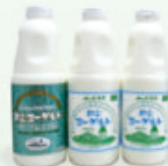
飲むヨーグルトセット