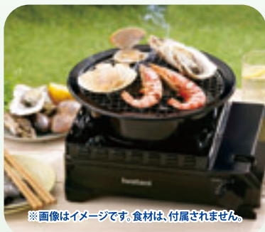
※画像はイメージです。食材は、付属されません。