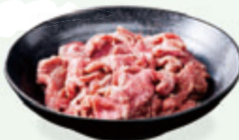
あもり和牛切落とし